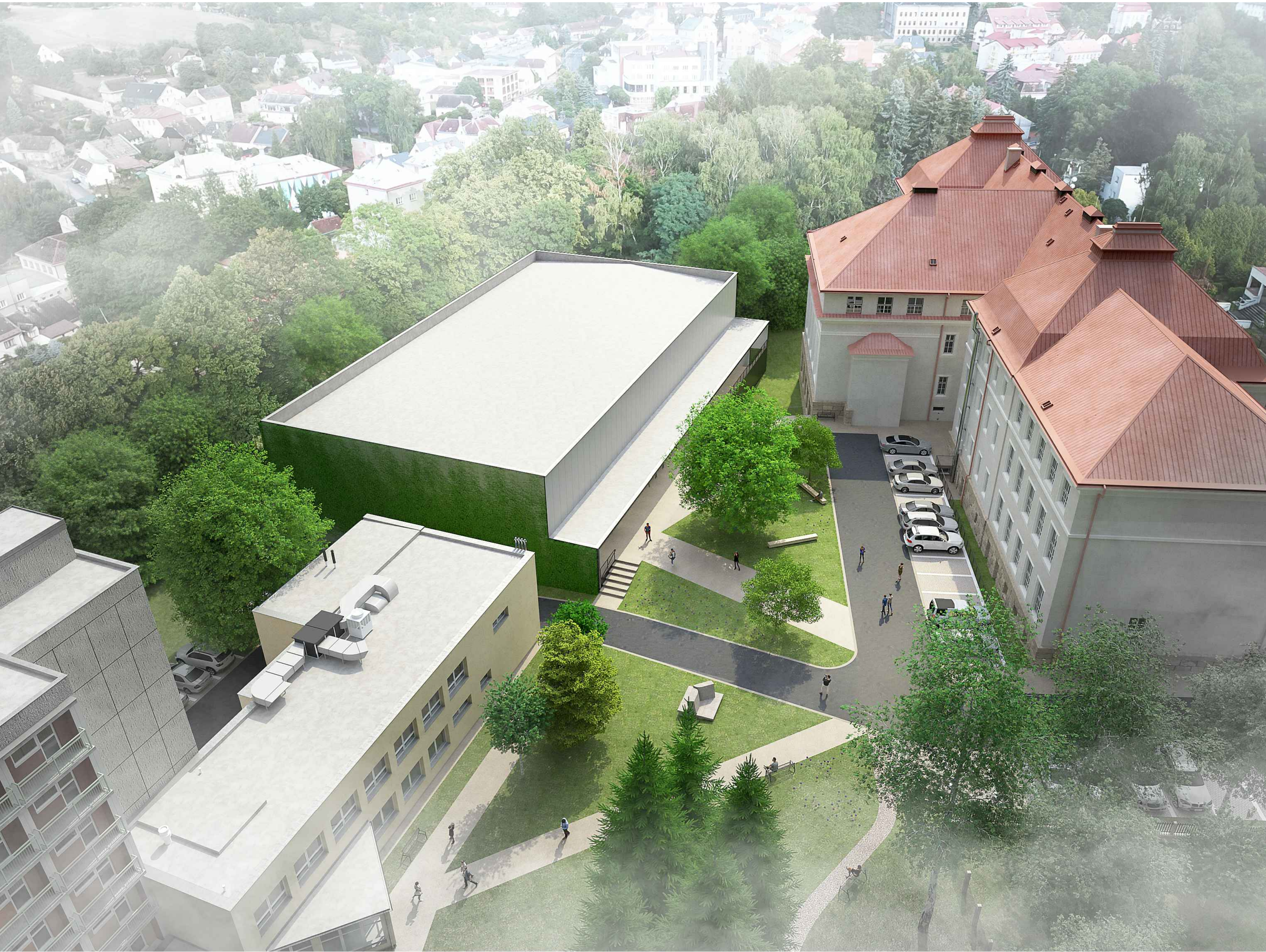
NADHLEDOVÁ PERSPEKTIVA - ZÁKRES DO FOTOGRAFIE