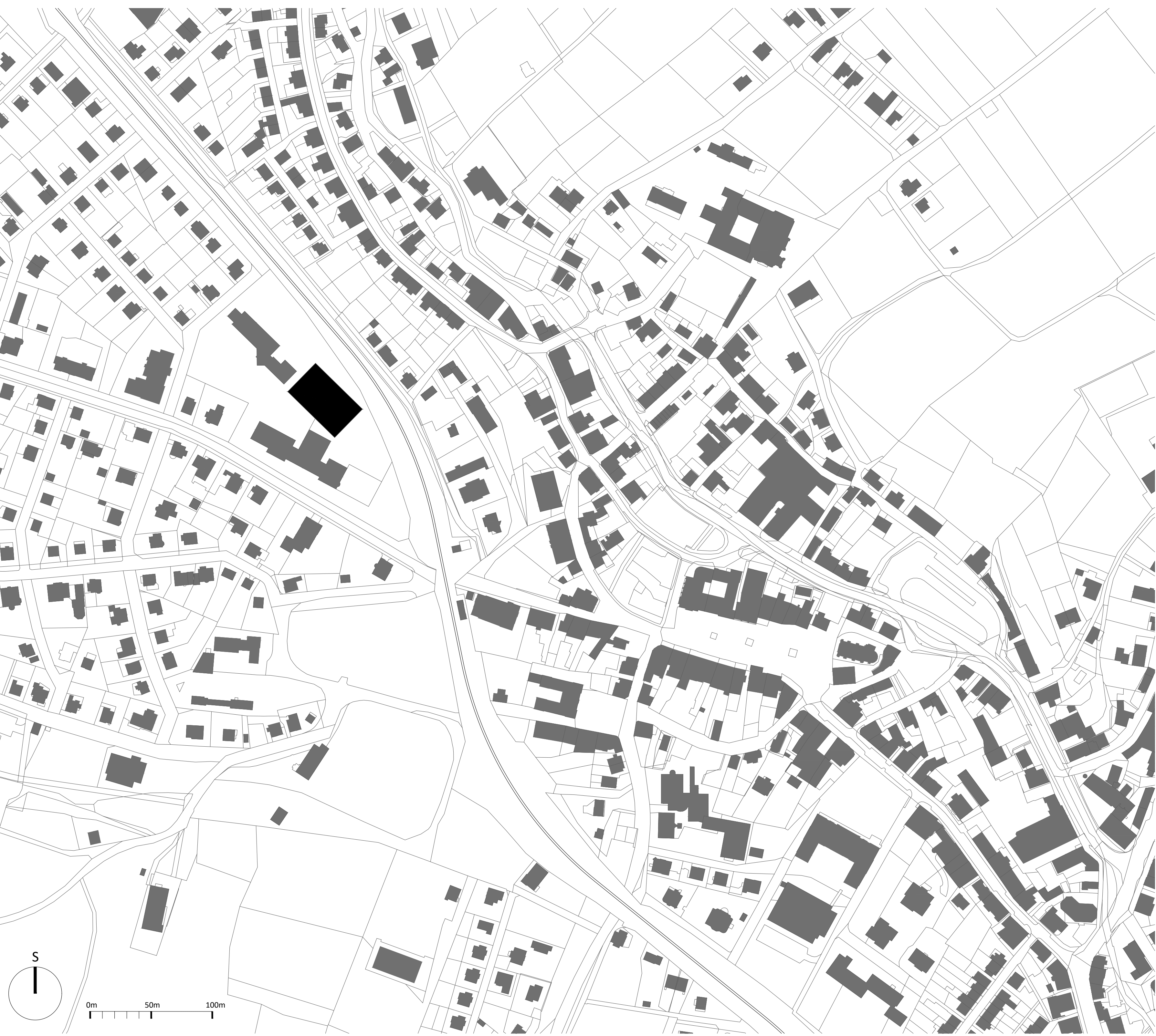
SITUACE ŠIRŠÍCH VZTAHŮ 1:2000